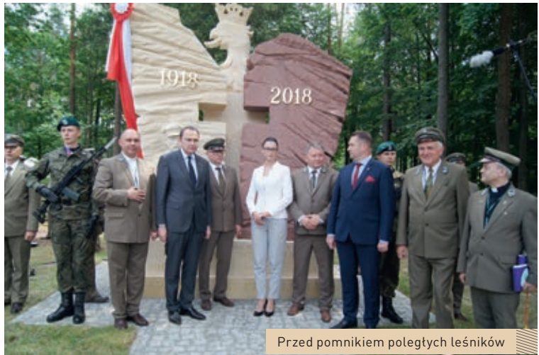
Przed pomnikiem poległych leśników