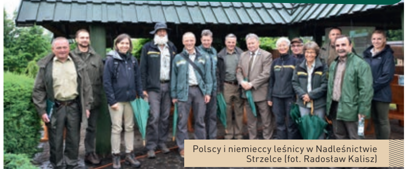
Polscy i niemieccy leśnicy w Nadleśnictwie Strzelce

Polscy i niemieccy leśnicy wykonują na co dzień podobne obowiązki, choć gospodarka leśna w obu krajach opiera się na zupełnie innych zasadach. Kolejna partnerska wizyta w lasach Lubelszczyzny była znakomitą okazją do wymiany doświadczeń i prezentacji rodzimego modelu leśnictwa, który w opinii wielu przedstawicieli braci leśnej może służyć innym państwom europejskim jako wzór do naśladowania. Pracownicy Nadleśnictwa Chełm starali się zobrazować specyfikę pracy w oparciu o zapisy planu urządzenia lasu. Podjęcie tego tematu sprowokowało liczne pytania ze strony leśników z Badenii-Wirtember-